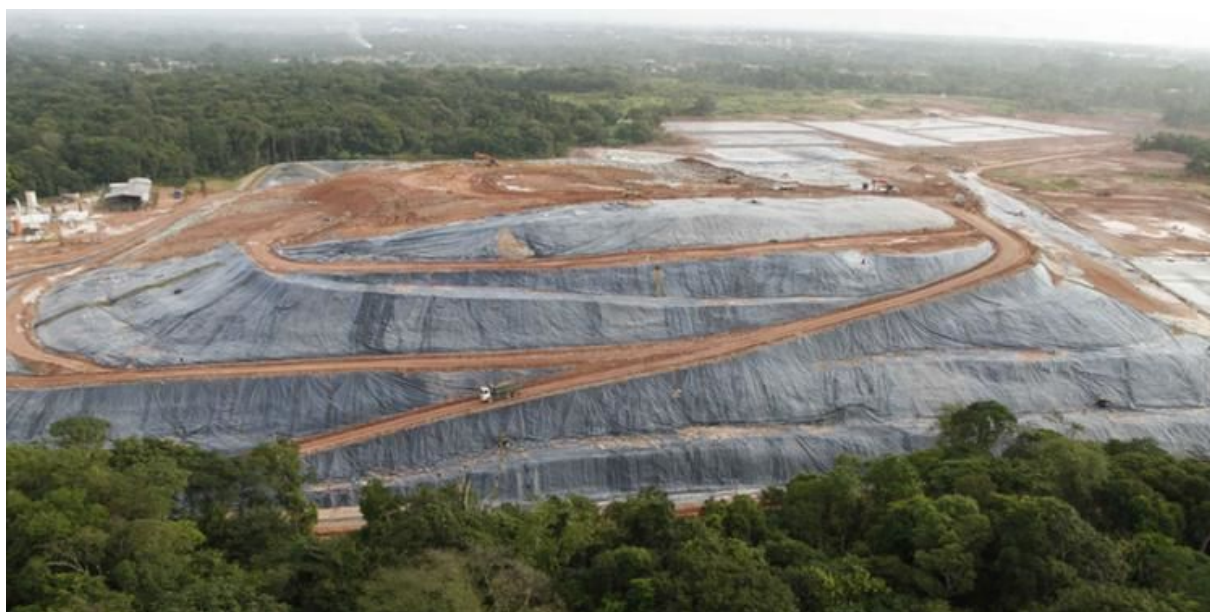
Figura 3: Aterro Sanitário GTR, em Marituba-PA.

Diante disto não há como negar a necessidade de investigar, analisar e compreender esta economia do lixo, seu desenvolvimento econômica e socioambiental em Belém e RMB, que é um tema de extrema importância, pois o lixo é uma questão que afeta a vida de todos e precisa ser tratado com a seriedade que este tema exige. Neste contexto, a economia do lixo abrange o setor público através da Prefeitura Municipal de Belém (PMB), que é responsável pelo gerenciamento dos resíduos sólidos, pelo Ministério Público do Estado (MPE) e a Ordem dos Advogados do Brasil (OAB), que servem de mediadores nos diversos conflitos entre a PMB, os catadores e a sociedade civil, pelo setor privado, representado pelas cooperativas e catadores de resíduos sólidos e também pela GTR, que é o aterro sanitário onde o lixo da RMB é depositado, para tratamento final, Figura 3, abaixo.