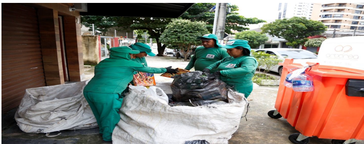
Figura 2: Lixo disposto nas ruas de Belém-PA.

Também foi visto que existe um enorme desperdício de materiais recicláveis pela falta de uma coleta seletiva mais eficiente e abrangente. Em Belém a coleta seletiva ocorre apenas nos bairros centrais, sendo verificada a inexistência da coleta nos bairros periféricos, Figura 2. A coleta seletiva produziu uma categoria de trabalhadores que é o catador, e é importante para o desenvolvimento e melhoria da nossa sociedade, valorizar e reconhecer o trabalho feito por esses catadores, pois eles trabalham de forma criativa, devido à necessidade, e em meio a um mercado de extrema exclusão e poucas oportunidades, atuam separando os resíduos que todos nós produzimos, encaminham para a reciclagem, reduzindo assim os impactos ambientais, que é gerado por todos nós de uma forma conjunta e não isolada.