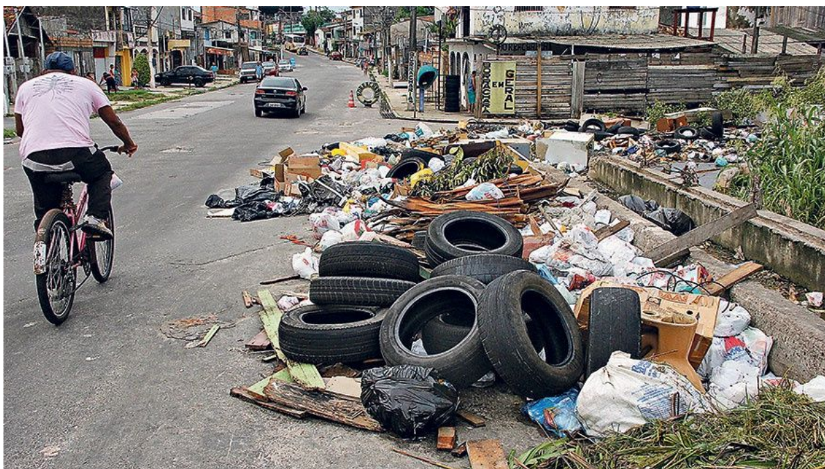
Figura 1: Lixo disposto nas ruas de Belém-PA.

Foi observado também que a coleta seletiva e reciclagem em Belém e na RMB têm a capacidade de proporcionar transformações sociais, gerando trabalho, emprego e renda e com isso resgatando pessoas e famílias inteiras, da extrema marginalização social, proporciona o direito à vida, ao trabalho e reduzindo a exclusão social tão presente em nossa atual conjuntura social. Além da redução dos impactos ambientais, que consequentemente proporcionam melhorias na estrutura urbana.