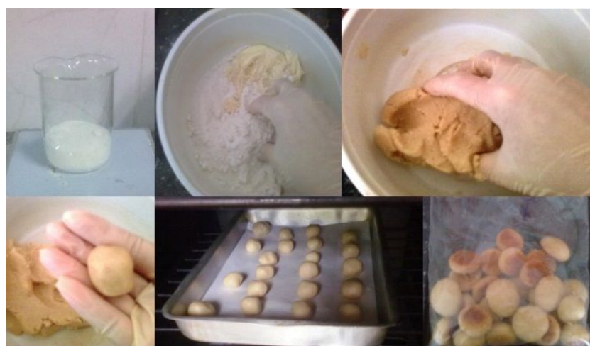
Figura 2: Etapas do processamento de biscoitos.

Todos os ingredientes foram pesados e misturados até que a massa fosse formada. Após essa etapa, os biscoitos foram modelados e assados por cerca de 30 minutos em uma temperatura média de 160 °C. Após assados, os biscoitos foram resfriados a temperatura ambiente e acondicionados em sacos plásticos, para análises posteriores. A Figura 2 ilustra as etapas desse processo.