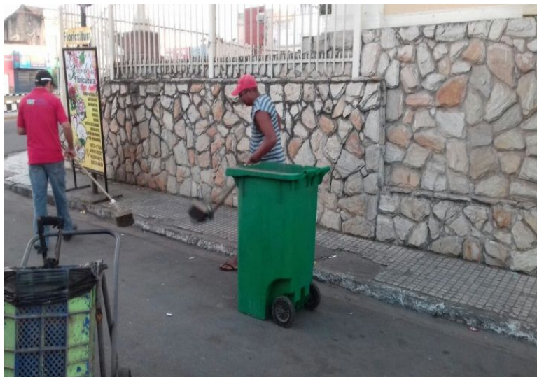
Figura 2: Varrição e Coleta dos Resíduos Sólidos Urbanos.

A prefeitura conta com 60 funcionários na área de varrição nas ruas acompanhados com carrinhos para o transporte dos resíduos sólidos urbanos. Além da varrição das ruas, a prefeitura por meio da Secretaria de Infraestrutura, é responsável também pela capinação, podas de árvores e limpeza de córregos. Em relação aos garis, a prefeitura não oferece nenhum tipo de segurança para eles no momento da varrição nas ruas, conforme aponta a (figura 2). Diante dessa realidade, os garis durante a realização do seu trabalho não utilizam Equipamentos de Proteção Individual (EPI), tais como: luvas de proteção, botinas, máscara de proteção e uniforme para facilitar a identificação do trabalho.