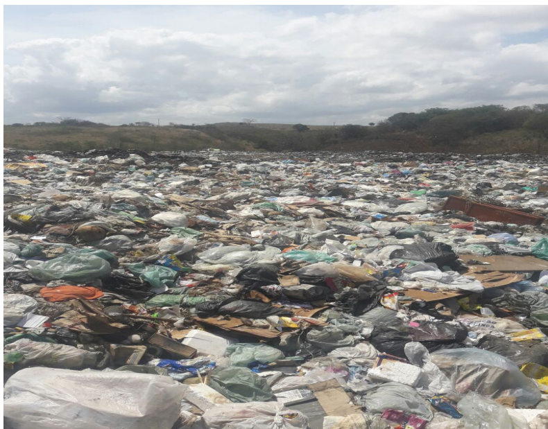
Figura 2: Lixão do Município de Nazaré da Mata.

Durante a visita à área de destinação final dos resíduos sólidos fizemos um levantamento fotográfico registrando uma situação caótica, pois os resíduos sólidos são compostos por uma diversidade ampla de componentes e de diversas composições como papéis, borrachas, vidros, plásticos, latas, metais entre outros. Depois de serem coletados são jogados em um terreno a céu aberto / lixão.