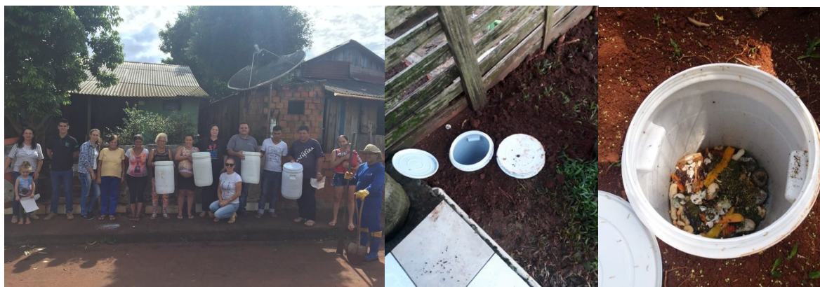
Figura 2 - Entrega das unidades e instalação pelas famílias contempladas.

Em um segundo momento, as famílias interessadas, eram cadastradas no Escritório Municipal da EMATER/ASCAR, e adquiriam a unidade. Aproximadamente 100 unidades foram instaladas nessa etapa. No final do ano de 2019, o projeto foi contemplado com mais 115 unidades, via Fundo de Desenvolvimento Regional, vinculado ao Sicredi Alto Uruguai. Essas unidades estão/foram instaladas nos primeiros meses de 2020, com auxílio da Prefeitura Municipal. Assim, no total se tem cerca de 320 unidades instaladas na área urbana.