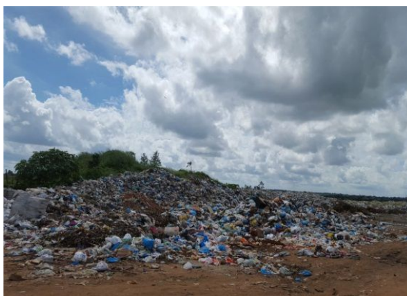
Figura 2: Lixão do Município de Feira Nova – PE.

O gerenciamento dos resíduos sólidos urbanos do Município de Feira Nova na atualidade consiste na coleta dos resíduos realizada diariamente nas ruas da cidade em dias alternativos, todo material coletado é destinado ao lixão (Figura 2). O município tem enfrentado dificuldades em desenvolver estratégias para adequar a gestão dos resíduos sólidos de acordo com os princípios, objetivos, instrumentos e diretrizes da PNRS.