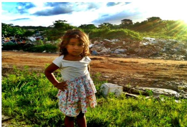
Figura 2: Criança no lixão.

Os catadores vivem ainda à margem de todos os direitos sociais e trabalhistas, excluídos da maior parte da riqueza que o mercado de reciclagem movimenta e produz. Como na Figura 2 , crianças e também adolescentes, que deveriam estar na escola, se encontram obrigados a trabalhar para garantir a própria sobrevivência.