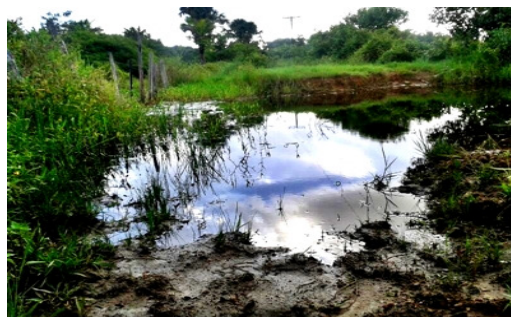
Figura 6: Poluição do córrego.

Com a indevida estrutura do terreno, juntamente com o mal posicionamento do lixo, o mesmo é direcionado proporcional à declividade do local, ocasionando a mistura do chorume escorrido, assim como a contaminação de nascentes e lençóis freáticos, interditando muitos locais hídricos que antes serviam para fazeres domésticos ou para o abastecimento de gados e outros animais, como é o caso no lixão Capanemense visto na Figura 6 .