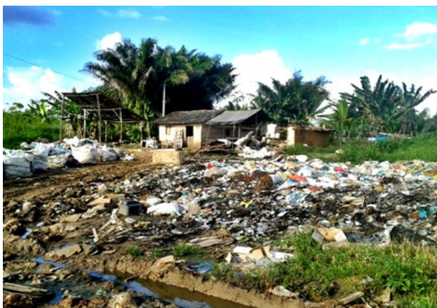
Figura 7: Uma das residências da Vila da Paz à margem do lixão.

Um lixão sem organização, em nenhum aspecto se tem evolução. Desse modo, pode-se deixar claro que a introdução de uma cooperativa em qualquer situação de lixão será melhor em razões ambientais, sociais e provavelmente econômicas. Tendo o foco de reconstruir muitos catadores que por uma vida inteira se sentiram invisíveis perante a sociedade, e para muitos até devolver a dignidade ajudando-o a se recompor e buscar novas portas de trabalho e oportunidades.