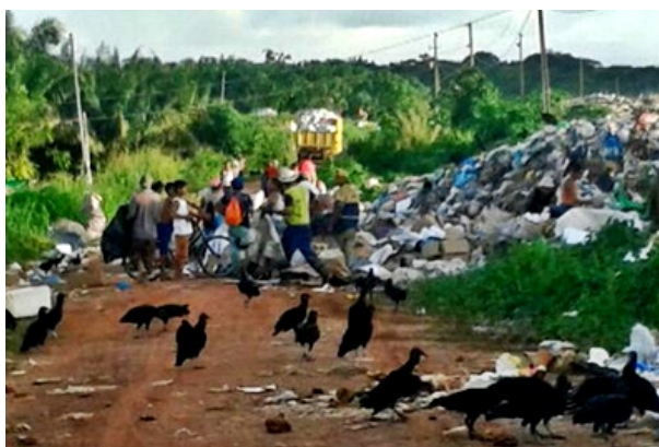
Figura 4: Alguns catadores da Vila da Paz no lixão.

A maioria dos lixões dos municípios brasileiros são localizados em terrenos indevidos, e sem nenhum estudo antecipado de área. Nesse sentido, são afetados solos, vegetações como na Figura 4 , córregos, entre outros fatores dentro da fauna e flora, podendo acarretar prejuízos irreversíveis ao meio ambiente que ali se encontra.