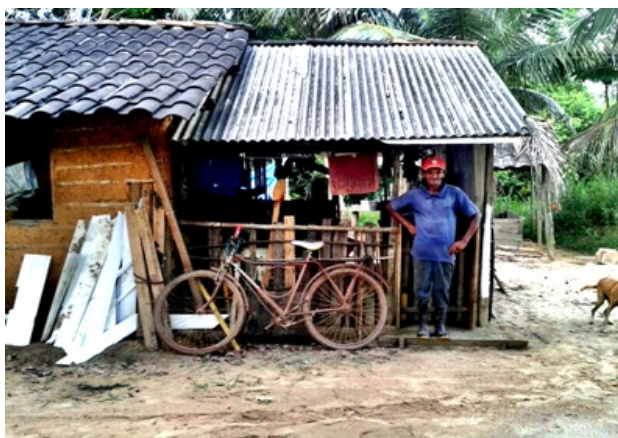
Figura 3: Morador da Vila da Paz.

Nesse aspecto, temos a visão sobre os mesmos casos que perpassam por muitos outros lixões que entre idosos, jovens e crianças, não tiram as suas vidas de dentro do lixo, sem expectativa de um melhoramento de vida, enxergam o lixão sem cooperativa o único meio para a sobrevivência. Essa visão compartilhada possibilita a valorização e a profissionalização do trabalho do catador, a inclusão social e o resgate da cidadania, bem como a retirada dos catadores dos lixões e aterros (SANTOS, 2011).