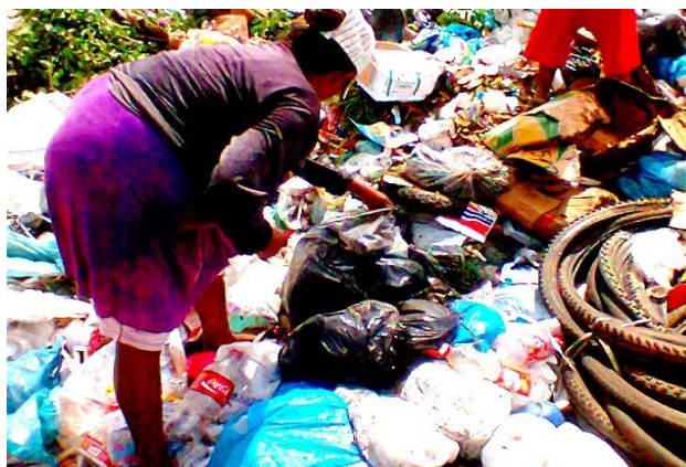
Figura 1: Idosa no lixão.

O lixão por situação de distância em relação à cidade, foi analisada a situação das crianças. Certas crianças são impactadas diretamente pela ausência da cooperativa, devido a ocupação de seus pais que passam o dia todo catando lixo para conseguir o máximo de renda no final do mês. Dessa forma várias crianças perdem a chance de serem direcionadas à escola por não ter a oportunidade de locomoção por seus pais, pois há ausência de dinheiro para transporte e falta de tempo para que seus responsáveis possam deixá-los à escola.