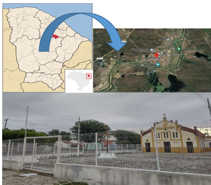
Figura 1: Detalhamento do campo da pesquisa.

A presente pesquisa será realizada na Instituição religiosa, localizada no Distrito de Caio Prado, pertencente ao Município de Itapiúna no sertão central do estado do Ceará. O público alvo do estudo será jovens participantes da catequese crismal (estima-se a quantidade de mais ou menos 30 jovens), jovens estes com idade igual ou superior a 14 anos, que frequentam a paróquia local por incentivo dos pais ou por vontade própria, a fim de fortalecer a fé e buscarem respostas a perguntas que permeiam o universo da juventude atual.