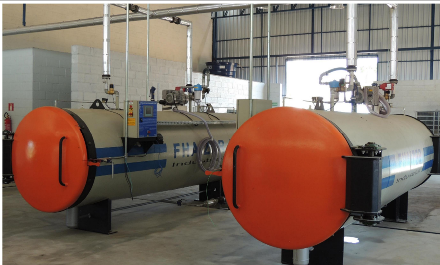
Figura 1. Máquina de autoclave.

Já os demais resíduos, grupos A2, A3 e B, são destinados a uma empresa terceirizada que realiza o tratamento por incineração, um tratamento que consiste na queima em alta temperatura.